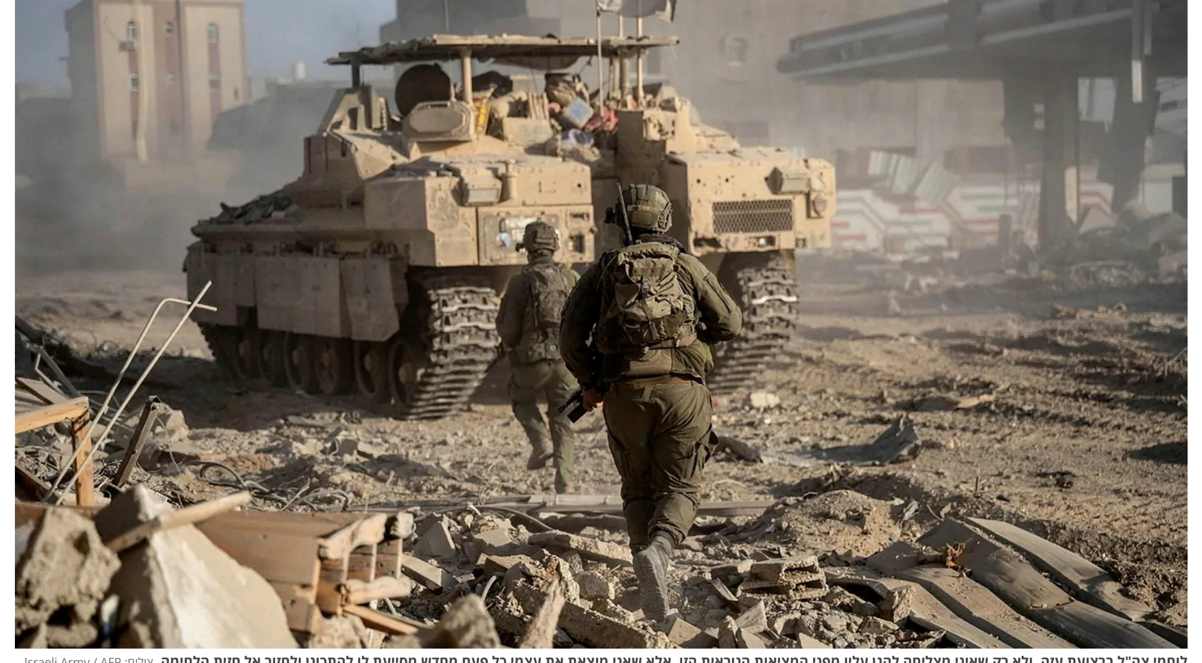
לחמי צב"ר בצועת עזה. ולא רק שאיני מצליחה להגן עליו מפני המציאות הנוראית הזו, אלא שאני מוצאת את עצמי כל פעם מחדש מסייעת לו להתכונן לחזור אל חיות הלווייתן

נעמה גלבר התראות במייל 2024 באוגוסט 26 • 13:36